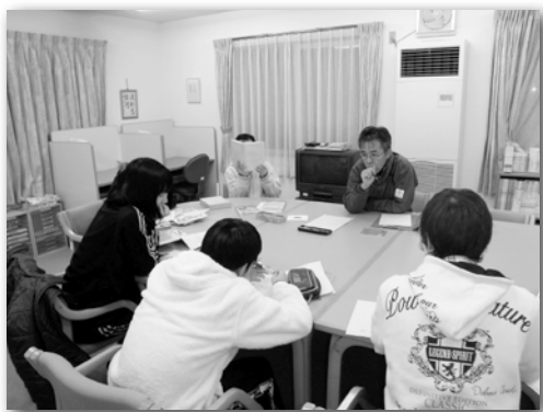
〈読書のへやでの学習〉

ドリルを使って、本人のできる範囲の内容を一緒に学習します。また、「高校入試に作文が出るから、それに挑戦する」と言い、スタッフのアドバイスで、一気に原稿を書き上げた子もいます。このような雰囲気につられて、教材を持参している子は短時間でも教科書を広げていきます。時にはクラスで無視されたり、いじめにあつて辛かった体験を話し出したり、リストカットにいたつた暗い体験を少しずつ話し始めたりする子も出てきて、夜半まで打ち明け話が續くこともあります。自分の辛かった体験を誰かに話すことができ、それを聴いてもらうことで、少しずつ気持ちが楽になります。