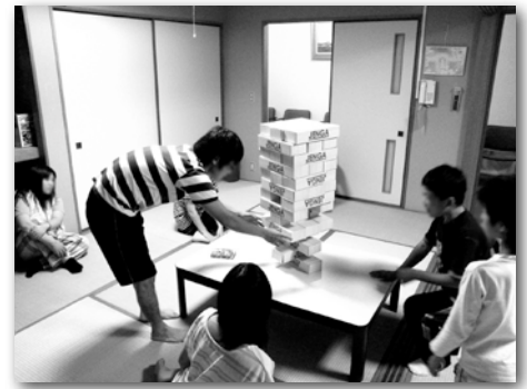
〈語らいのへやでのジェンガ〉

子どもたちは、遊びのへやで卓球やダーツに興じたり、ビリヤードで技を競ったりします。エレクトーンの演奏をしたり、カラオケで熱唱したりする子もいます。語らいのへやでは、ジェンガやトランプなどのカードゲームに興じる時もあります。また、上級生がリーダーシップを発揮し、かくれんぼなどの集団遊びを楽しむこともあります。みんなが楽しめるように話し合って、ルールを工夫していきます。やまびこタイムでの学習の際、高校進学を控えた中学3年生が「俺、高校へ行こうと思うんやけど、どんな勉強をしたらいい？」と言うこともあります。そんな時には、