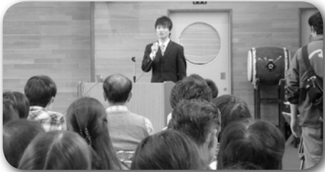
〈学生ボランティアの講話〉

平成22年10月31日（日）に県内各地より約370名の皆様に参加して頂き、但馬やまびこの郷民交流事業「やまびこフェスタ～心の虹を未来へ～」を開催しました。施設を開放し、当所の活動の中で行っている餅つき、焼き板等を体験していただくことを通して、「但馬やまびこの郷」について知ってもらうとともに、不登校について理解していただく機会となりました。当日の様子を紹介します。