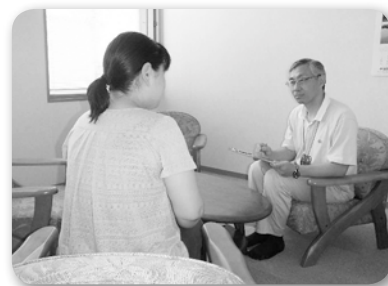
(カウンセリングルーム 1)

不登校の相談については、1回の面談で解決したり原因が分かったりすることはほとんどありません。それよりも、保護者や指導者との信頼関係を構築し、「来てよかった」と感じて頂くなど、次につながる面談を心がけています。